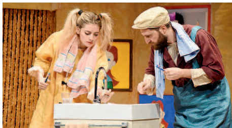
Un momento dello spettacolo

sensibilizzare i bambini dai 3 ai 10 anni sui temi della salute e sicurezza, indicando loro un corretto utilizzo delle principali fonti energetiche, come: acqua, gas metano e corrente elettrica. L'iniziativa è interamente a carico di Gas Sales energia, azienda con sede ad Alseno. Lo spettacolo era partito il 6 ottobre 2017 ed era stato replicato nelle scuole di Piacenza e Fiorenzuola e proseguito: al teatro Verdi di Fiorenzuola e di Castelsangiovanni, all'oratorio di Cadeo, al teatro Du-se di Cortemaggiore, al castello La