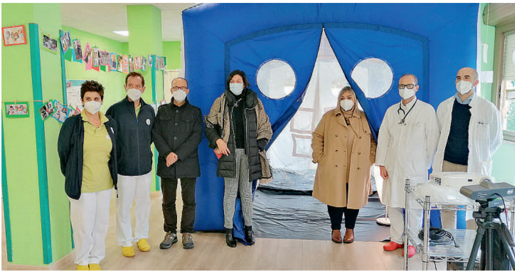
L'inaugurazione della "stanza degli abbracci" alla Fondazione Opere Pie