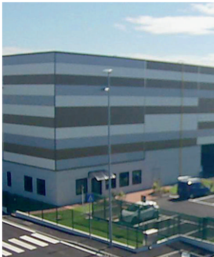
L'Hub Ovs di Pontenure affidato alla multinazionale Xpo Logistics