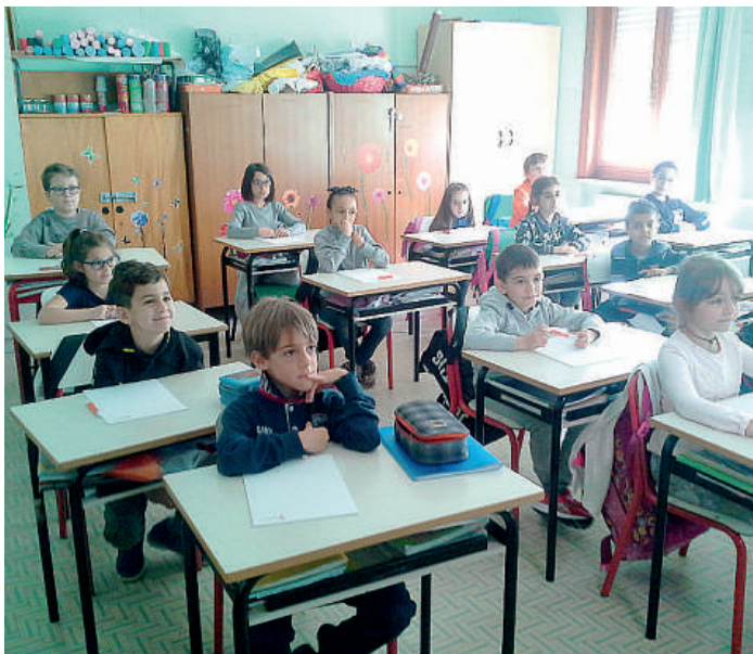
"Natura che cura" è stata spiegata agli studenti della don Minzoni FARAVELLI

La natura è nostra amica, la possiamo usare per curarci seguendo rimedi che si basano sull'uso di semplici fiori o delle piante. Questo il segreto che hanno imparato i piccoli alunni della scuola Don Minzoni di Piacenza, tappa locale del progetto nazionale "Natura che cura". "Natura che cura" è un'iniziativa promossa da AMIOT, l'Associazione Medica Italiana di Omotossicologia costituita, senza scopo di lucro, da medici chirurghi esperti in medicine di origine biologico-naturale. "Natura che cura" parla dunque alle scuole italiane, allo scopo di sensibilizzare i giovani alla prevenzione delle malattie e alla conduzione di stili di vita salutari. È stata la dottoressa