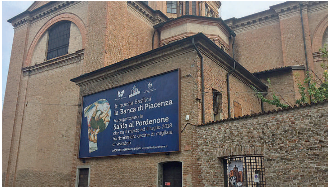
Il nuovo cartellone che da ieri campeggia sulla basilica per celebrare l'evento. Riapertura dal 3 al 7 ottobre