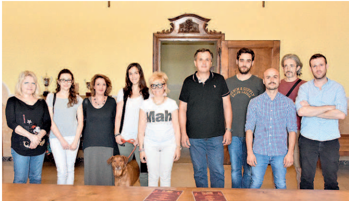
I partecipanti alla conferenza stampa di presentazione del Fillmore Summer Festival

Dal 20 al 22 luglio nel chiostro del convento della Santissima Annunziata: ospiti Grignani, Nada, Pedrini e tante band locali